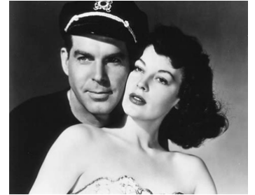
1947 SINGAPOUR (Singapore) de John Brahm avec Fred MacMurray