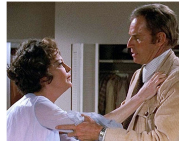
1974 TREMBLEMENT DE TERRE (Earthquake) de Mark Robson avec Katharine Hepburn