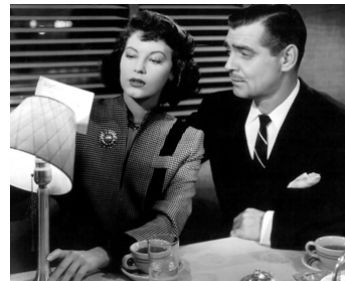
1947 MARCHANDS D'ILLUSIONS (The Hucksters) de Jack Conway avec Clark Gable