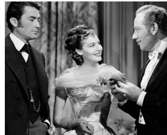
1949 PASSION FATALE (The great Sinner) de Robert Siodmak avec Gregory Peck, Melvyn Douglas