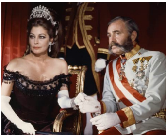
1968 MAYERLING (Mayerling) de Terence Young avec James Mason