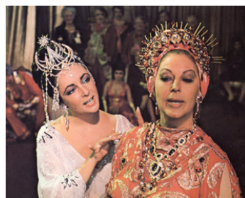
1975 L'OISEAU BLEU (The blue Bird) de George Cukor avec Elizabeth Taylor