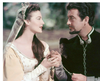
1953 LES CHEVALIERS DE LA TABLE RONDE (Knights of the round table) de R. Thorpe avec Robert Taylor