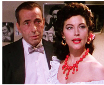
1954 LA COMTESSE AUX PIEDS NUS (The barefoot Countess) de J. Mankiewicz avec Humphrey Bogart