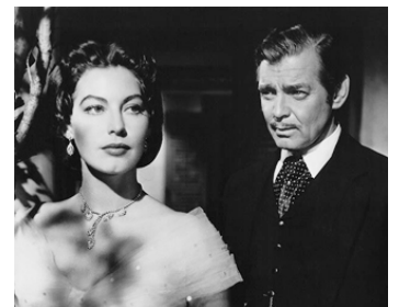
1951 L'ÉTOILE DU DESTIN (The lone Star) de Vincent Sherman avec Clark Gable