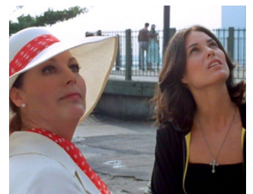
1976 LA SENTINELLE DES MAUDITS (The Sentinel) de Michael Winner avec Cristina Raines