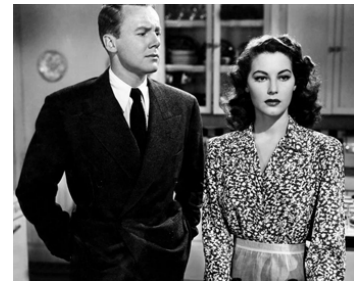
1944 TROIS HOMMES EN BLANC (Three Men in White) de Willis Goldbeck avec Van Johnson