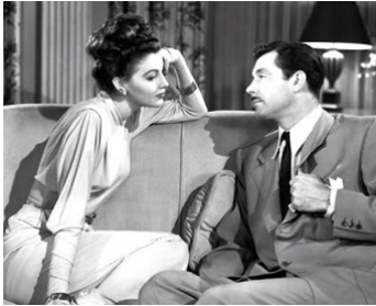
1945 SHE WENT TO THE RACES de Willis Goldbeck avec James Craig