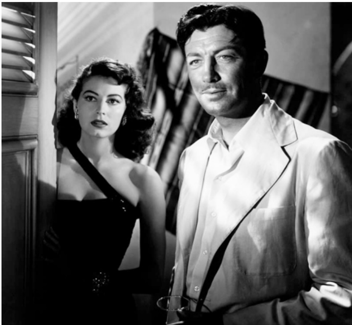
1948 L'ÎLE AU COMLOT (The Bribe) de Robert Z. Leonard avec Robert Taylor