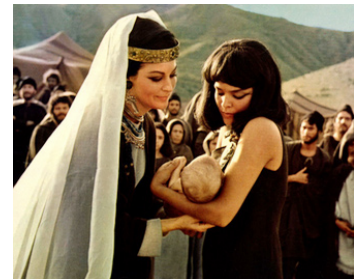
1965 LA BIBLE (The Bible in the beginning) de John Huston avec Zoe Sallis