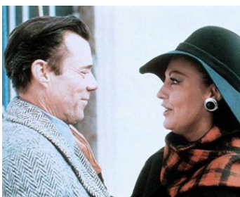
1975 LA TRAHISON (Permission to kill) de Cyril Frankel avec Dirk Bogarde