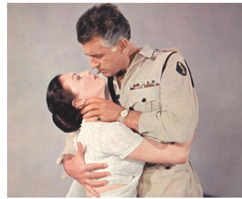
1955 LA CROISÉE DES DESTINS (Bhowani Junction) de George Cukor avec Stewart Granger