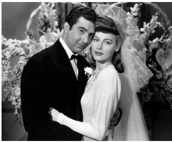
1943 GHOSTS ON THE LOOSE de William Beaudine avec Rick Vallin