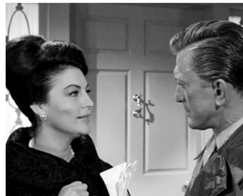
1963 SEPT JOURS EN MAI (Seven days in may) de John Frankenheimer avec Kirk Douglas