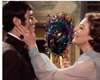
1969 TAM LIN (The Ballad of Tam Lin) de Roddy McDowall avec Ian McShane