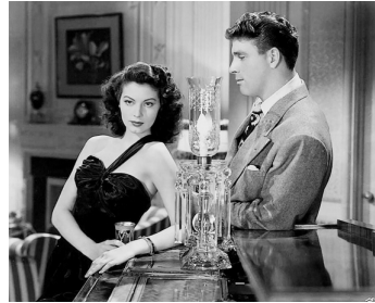
1946 LES TUEURS (The Killers) de Robert Siodmak avec Burt Lancaster