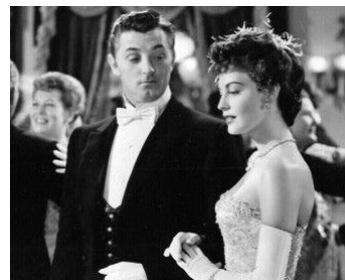
1951 MON PASSÉ DÉFENDU (My forbidden Past) de Robert Stevenson avec Robert Mitchum