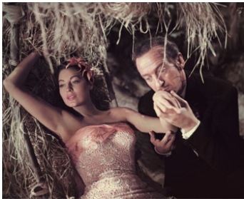
1957 LA PETITE HUTTE (The little Hut) de Mark Robson avec David Niven