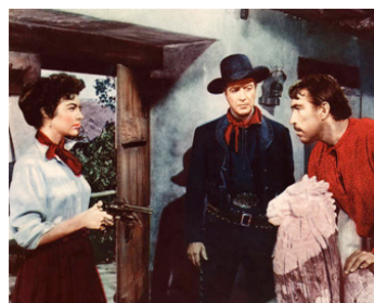
1952 VAQUERO (Ride, Vaquero) de John Farrow avec Robert Taylor, Anthony Quinn