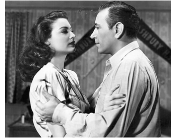
1946 TRAGIQUE RENDEZ-VOUS (Flamingo Bar) de Leonide Moguy avec George Raft