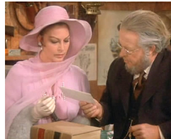
1971 JUGE ET HORS-LA-LOI (The life and time of Judge Roy Bean) de J. Huston avec Ned Beatty