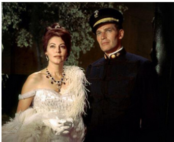
1962 LES 55 JOURS DE PÉKIN (Fifty-five days at Peking) de Nicholas Ray avec Charlton Heston