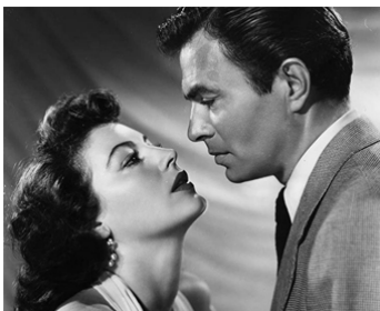
1951 PANDORA (Pandora and the flying Dutchman) d'Albert Lewin avec James Mason