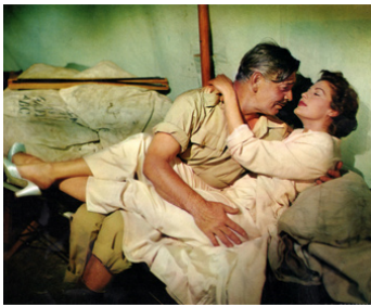
1953 MOGAMBO (Mogambo) de John Ford avec Clark Gable