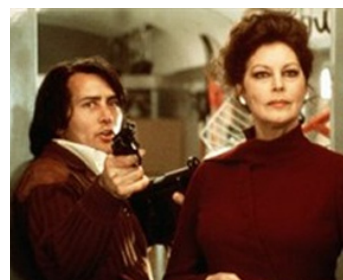
1976 LE PONT DE CASSANDRA (The Cassandra Crossing) de George P. Cosmatos avec M. Sheen