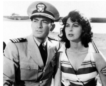
1959 LE DERNIER RIVAGE (On the Beach) de Stanley Kramer avec Gregory Peck