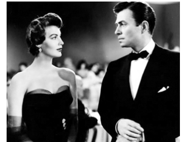
1949 VILLE HAUTE, VILLE BASSE (East Side, West Side) de Mervyn LeRoy avec James Mason