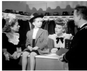
1943 L'ANGE PERDU (Lost Angel) de Roy Rowland avec Margaret O'Brien