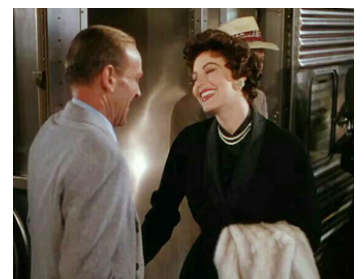
1953 TOUS EN SCÈNE (The Band Wagon) de Vincente Minnelli avec Fred Astaire