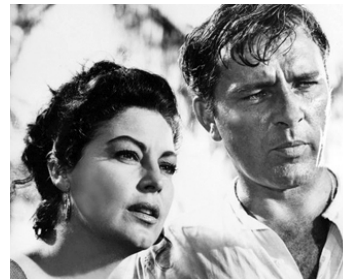
1964 LA NUIT DE L'IGUANE (The Night of the Iguana) de John Huston avec Richard Burton