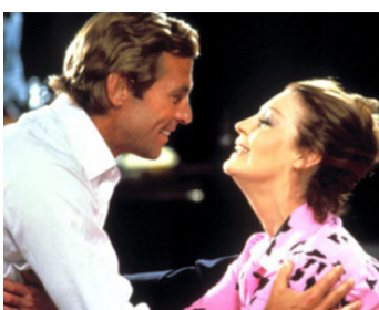
1978 LA CITÉ EN FEU (City on Fire) d'Alvin Rakoff avec James Franciscus