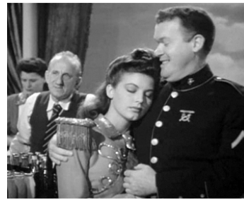
1944 TWO GIRLS AND A SAILOR de Richard Thorpe avec Jimmy Durante, Frank Sully