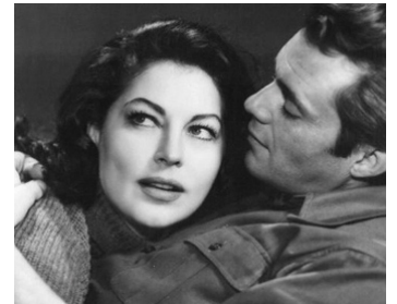
1960 L'ANGE POURPRE (The Angel wore red) de Nunnally Johnson avec Dirk Bogarde