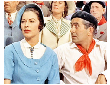
1956 LE SOLEIL SE LÈVE AUSSI (The Sun also rises) d'Henry King avec Tyrone Power