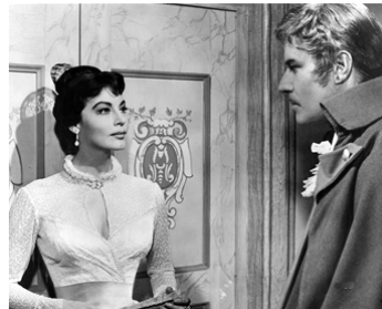
1958 LA MAJA NUE (La Maja desnuda) d'Henry Koster avec Amedeo Nazzari