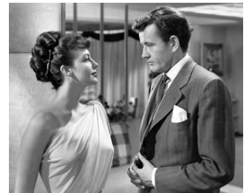
1948 UN CAPRICE DE VÉNUS (On Touch of Venus) de William A. Seiter avec Robert Walker